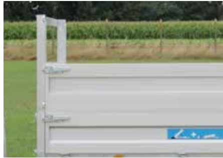
Enkele rij opzetborden (H = 50cm)