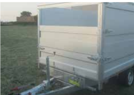
MODULA - Enkele rij Neerklapbaar voorbord met uitschuifbaar opzetbord (H=50cm)