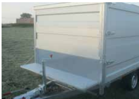
MODULA - Dubbele rij Neerklapbaar voorbord met 2 uitschuifbare opzetborden