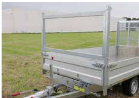
MODULA - Basis Neerklapbaar voorbord met verstelbare liggers