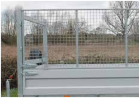
Loofrek (H = 100cm)