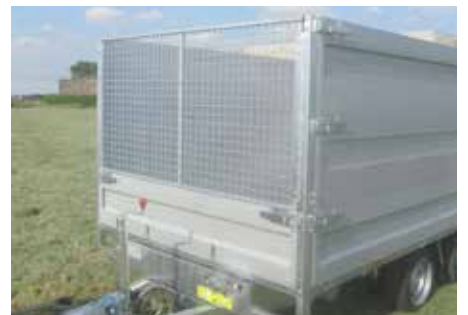
MODULA - Loofrek Neerklapbaar voorbord