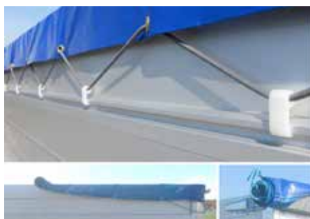
Versterkt zeil/gaasnet met oprolhulp en opbergplaats (2)