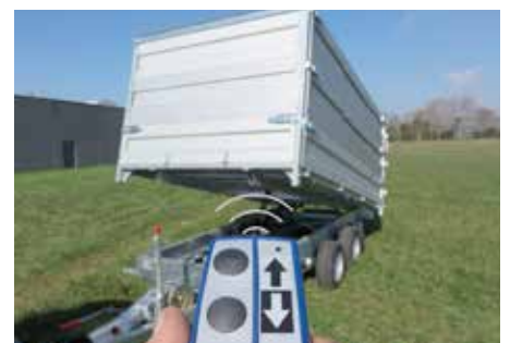
Afstandbediening voor kappen en kantelen.

(1) Enkel leverbaar in combinatie met optie voorkant MODULA