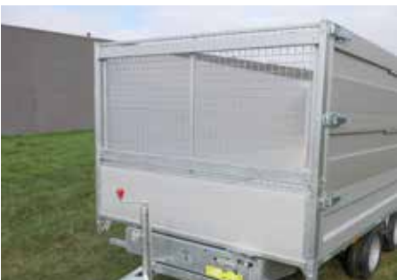
Loofrek op standaard voorrek (H = 100cm)