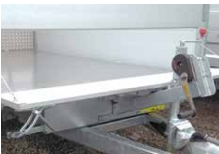
Manuele lier met steun op voorzijde (1)