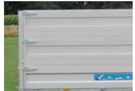
Dubbele rij opzetborden (H = 2x50cm)